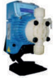
Proplü Dijital Bulaşık Makinesi Deterjan Parlaticı Pompası