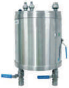
Çift Girişli Uydu Ünitesi