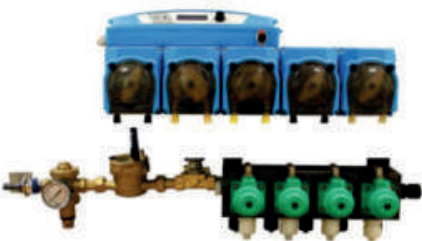
Çamaşır Makinesi Sıvı Dozaj Sistemi