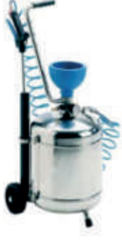
Mobil Köpük Tankı