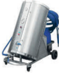
Mobil Pompa Ve Uydu Ünitesi