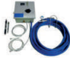
Çift Girişli Köpük Aparatı