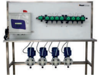
Çamaşır Makinesi Merkezi Sıvı Dozaj Sistemi