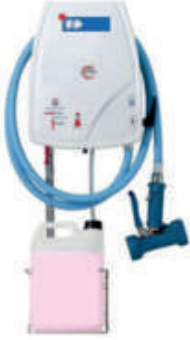
Sprey Hortum Sistemi