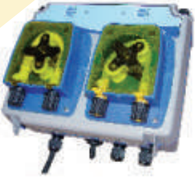
Bulaşık Makinesi Deterjan parlaticı pompası