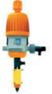
Tek Girişli Seyreltme Ekipmanı