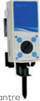
Konsantr Ürün Seyreltme Aparatı