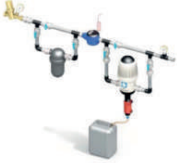
Ekipman Uygulama Şeması