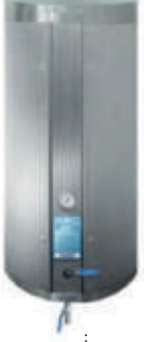
Ana Pompa İstasyonu