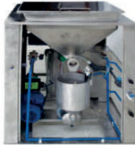
Çamaşır Makinesi Merkezi Toz Dozaj Sistemi